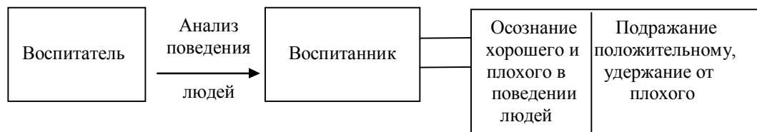
Рис. 2. Использование метода анализа в воспитании детей

Если следовать такой логике системы воспитания, то отпадает необходимость в необъективном применении поощрения и наказания.