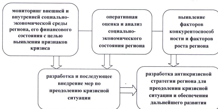
Рисунок 1. Схема механизма антикризисного управления регионом

Антикризисное управление на уровне региона должно основываться на применении следующего механизма (рис. 1).