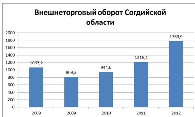
Рис.1. Динамика внешнеторгового оборота Согдийской области за 2008-2012 гг., млн. долл.

Источник: Статистический ежегодник Согдийской области. Главное управление Агентства по статистике при Президенте Республики Таджикистан в Согдийской области. –Худжанд, 2013. -С. 199.