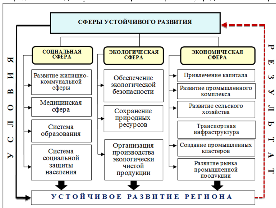
Рис. 1. Концепция устойчивого развития региона

Последнее указывает на приоритетность развития корпоративных форм управления субъектами региональной экономики, преимущественно на базе реструктуризации промышленных предприятий, способных обеспечить взаимодействие потенциала отдельных предприятий, предпринимателей, населения и государства на пути достижения параметров конкурентоспособности национальной экономики. На основе анализа современных подходов к вопросам регионального развития на принципах устойчивого развития авторами предложена модель устойчивого развития региона, представленная на рис. 1.