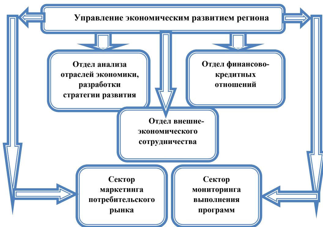
Рис. 1. Структура управления экономикой регионов Согдийской области

Организационно - экономический механизм управления региональной экономикой и его действие направлены на создание условий для эффективной деятельности субъектов хозяйствования, и прежде всего предпринимательских структур (рис. 1).