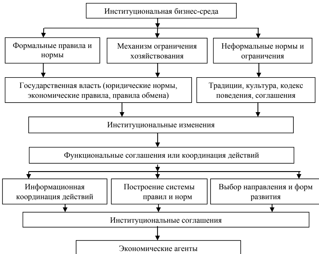
Рис. 1 Институциональная бизнес-среда в региональной экономике

Особое место в институциональной среде занимают микроинституты, определяющие взаимодействие членов общества в коллективе (рис.1).