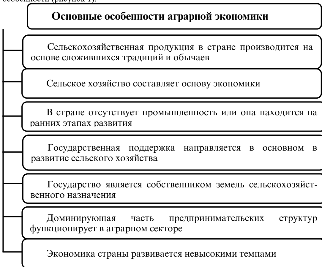
Рисунок 1 – Основные особенности аграрной экономики

При изучении аграрной экономики можно выделить следующие её основные особенности (рисунок 1).