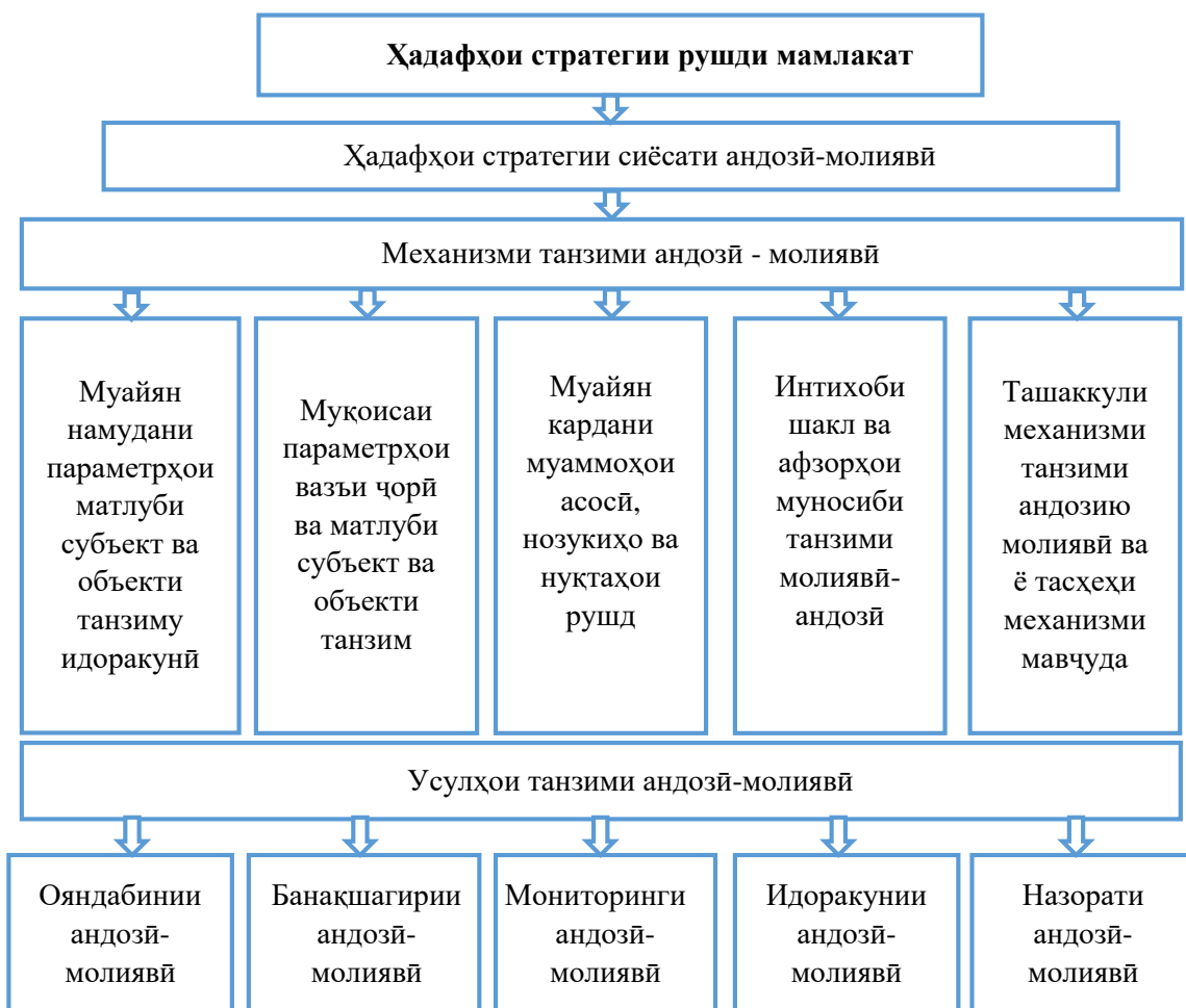
Расми 1. Механизми танзими андозӣ-молиявии равандҳои иҷтимоӣ-иқтисодии мамлакат

Тавре аз расми 1 мушоҳида мегардад механизми танзими андозӣ-молиявӣ амалӣ намудани ҷорая тадбирҳои пайваста ва илман асосноку низоммандро тақозо менамояд, ки дар доираи ҳадафҳои стратегии сиёсати андозӣ-молиявии мамлакат тавассути усулҳо ва афзорҳои хос амалӣ карда мешавад. Чун қоида ин танзим бояд барои расидан ба ҳадафҳои стратегии рушди