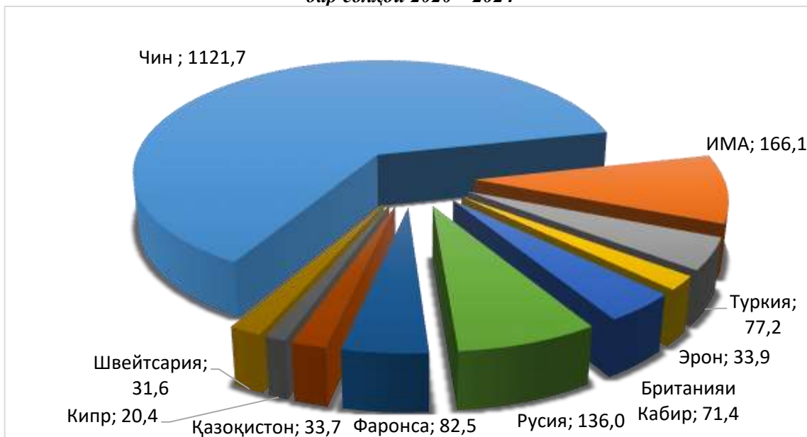
Тақсими сармояи мустақими хориҷии воридгардида аз рӯи таснифи кишварҳо дар солҳои 2020 – 2024