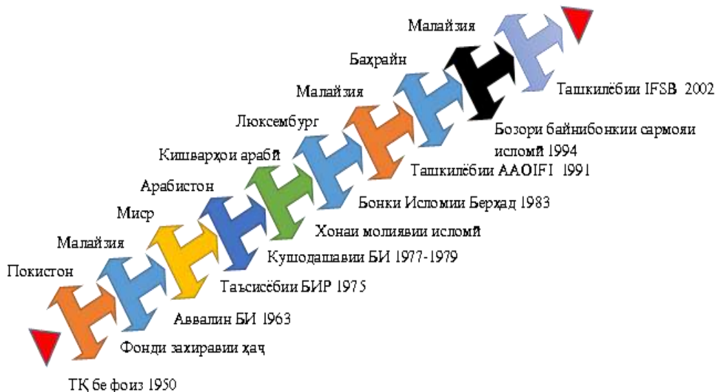
Расми 1. – Ташаккул ва рушди низоми бонкдории исломӣ: таҳлили хронологии марҳилаҳо

Аз мадракҳо бармеояд, ки солҳои 1960-ум Фонди захиравии ҳаҷ дар Малайзия таъсис ёфта аст, ки он намунаи аввалин барои ҷобачогузории молиявӣ бо риояи талаботи шариат ба ҳисоб меравад. Аввалин бонки исломӣ дар Миср соли 1963 таъсис ёфт буд, ки ташаккули заминаи институтсионалии низоми молиявии исломиро инъикос менамояд.